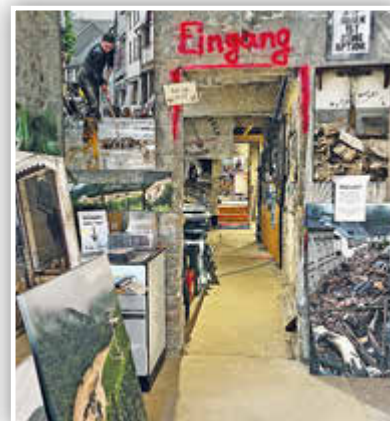
... die außer vielen Bildern auch mehrere Filmsequenzen beinhaltet.

AHR TAL. AFI. Auch fast zwei Jahre nach der verheerenden Flut ist das Ausmaß der Schäden entlang der Ahr weiterhin gegenwärtig. An vielen Stellen sieht es auf den ersten Blick noch immer nicht danach aus – doch es geht voran. Inhaber von Hotels, Restaurants und Geschäften haben, samt ihrer Mitarbeiter*innen, unzählige Stunden Arbeit, verbunden mit viel Hoffnung und Mut, in den Wiederaufbau ihrer geschäftlichen Existenzen gesteckt. Das Ziel: Endlich wieder zahlreiche Tages- und Übernachtungsgäste sowie Kundinnen und Kunden begrüßen zu können. Wanderfreudige Besucher*innen des Ahr tals dürfen sich, neben unvergesslichen Stunden in grandioser Natur entlang