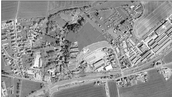
Geltungsbereich 1. Änderung Bebauungsplan „Allgemeines Wohngebiet / Mischgebiet Sonnenhügel Kloster Veilsdorf“ der Gemeinde Veilsdorf

Der Gemeinderat der Gemeinde Veilsdorf hat am 08.02.2023 mit der Beschluss-Nr.: 05/23 in der öffentlichen Sitzung den Beschluss zur Aufstellung des 1. Änderung Bebauungsplan „Allgemeines Wohngebiet / Mischgebiet Sonnenhügel Kloster Veilsdorf“ der Gemeinde Veilsdorf beschlossen.