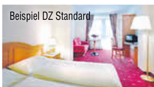
Beispiel DZ Standard