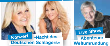
Konzert »Nacht des Deutschen Schlagers«