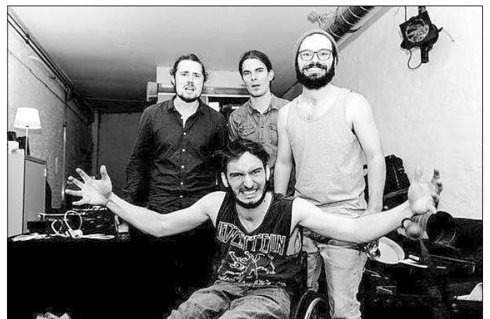
Fheels aus Hamburg