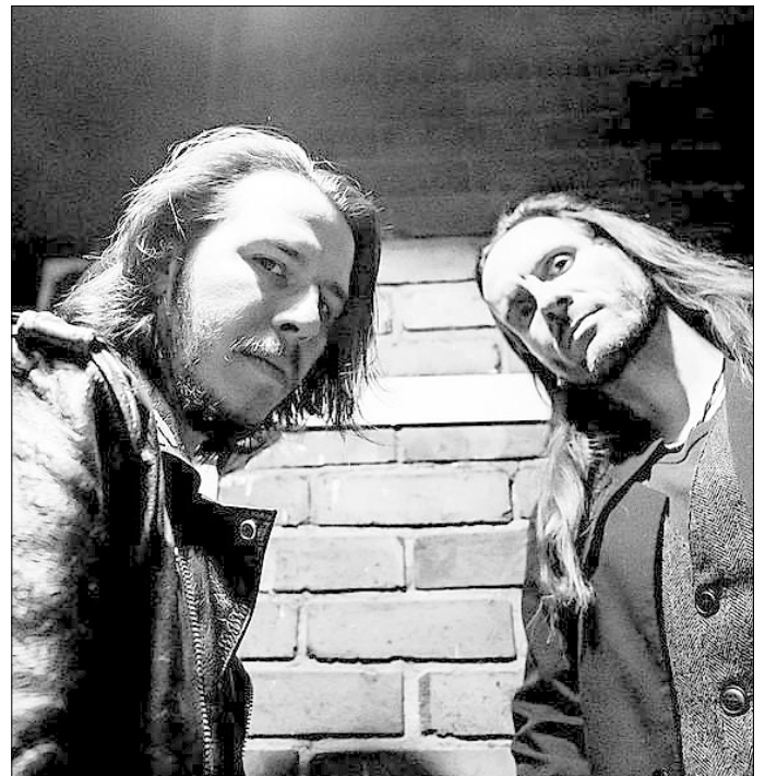
Osaka Rising aus Erfurt