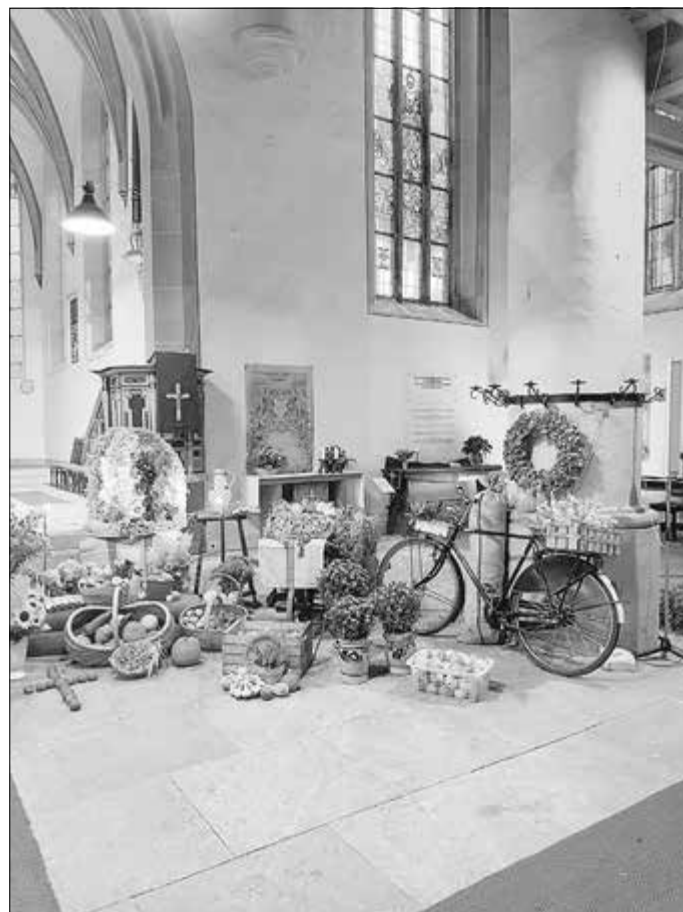
Erntedankgottesdienst in der Dreifaltigkeitskirche Eisfeld