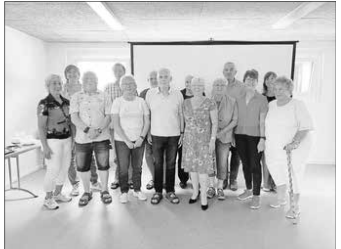
Foto des neu bestellten Seniorenbeirats, Stellvertreter und Gäste

Der Vorstand Seniorenbeirat Landkreis Hildburghausen